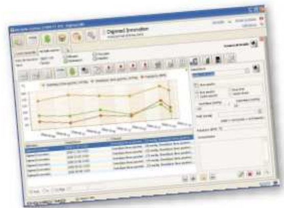
Exemple de suivi de l'évolution de la tension artérielle d'un patient